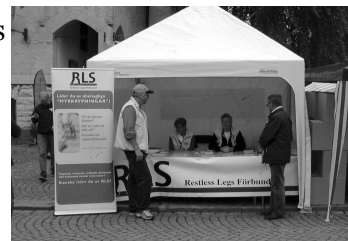
Under vissa perioder kunde det vara väldigt lugnt