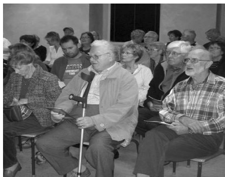
Åhörare i Tranås

Vi fick direkt på kvällen 2 nya medlemmar och sålde också 3 Rastlösa ben - sömnlösa nätter.