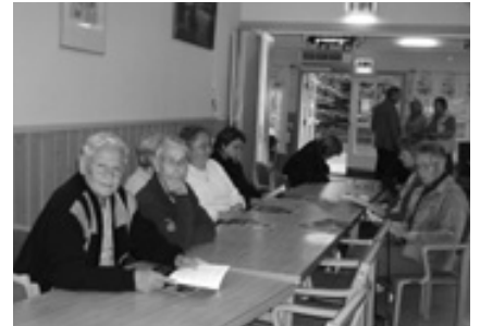
RLS intresserade i Leksand