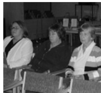
Från Mötet i Älvdalen

Man räknar med att 80% även har ofrivilliga benrörelser oftast i sömnen, dessa kan vara så kraftiga att personen sparkar sönder sängkläder. Den som har RLS säger ofta att de har myror i benen.