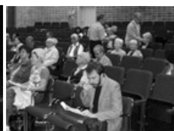
Åhörare i Jönköping